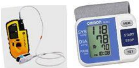
Oxymètre et tensionmètre intégrés à l'e-health backpack [12]

Pour répondre au défi du vieillissement des populations les plus pauvres, des expérimentations sont lancées dans certains pays dans le but de développer de nouvelles applications de télésanté (e-health). L'objectif consiste à tester des méthodes et solutions innovantes permettant d'améliorer la qualité des services de soins tout en réduisant les coûts induits pour la communauté.